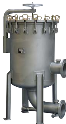
40-fach Patronenfilter aus der Baureihe KWF