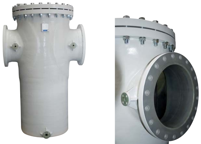
KWF DN 500 aus GFK