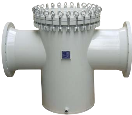
KWF DN 500